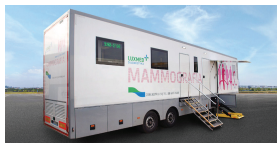
Mammobus LUX MED

58 666 24 44 MAMMOGRAFIA JAK www.mammo.pl