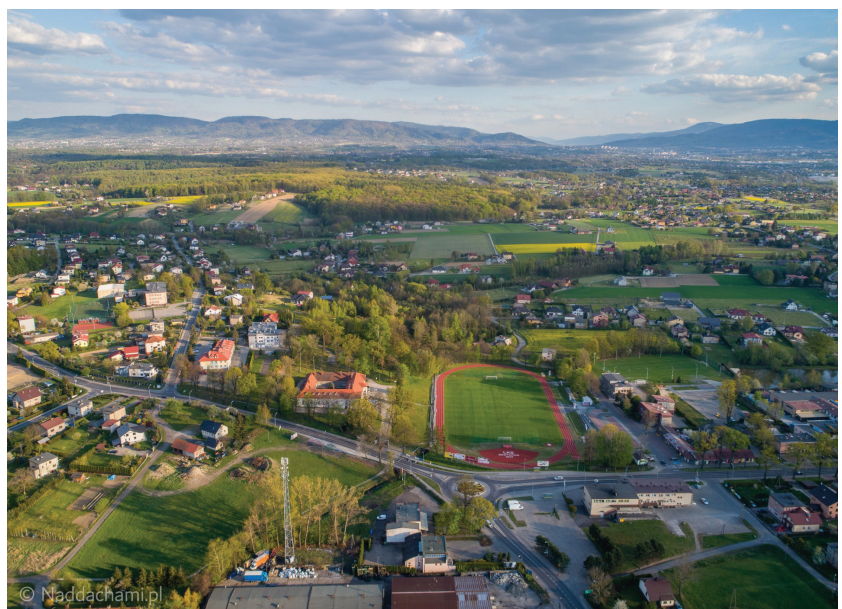
Gmina dynamicznie się rozwija