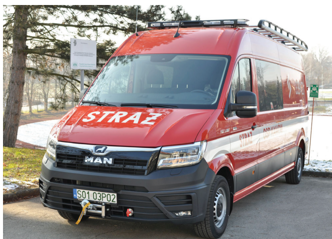
Lekki MAN będzie woził ekipę mistrzów Polski

Nie zabrakło miejsca na przemówienia. Minister Wójcik mówił w Bestwinie m.in. Władze rządowe zdecydowały o tym, żeby znaczną część tzw. Funduszu Sprawiedliwości przeznaczyć na różne inicjatywy, które dotyczą wspierania Ochotniczej Straży Pożarnej. W całym kraju takich jednostek jest 16 tysięcy i wła-