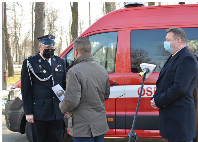
Wójt wręcza akt przekazania samochodu